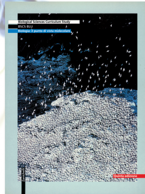
BSCS (Biological Sciences Curriculum Study) BSCS blu Biologia: il punto di vista molecolare Quinta edizione 1996