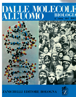
BSCS (Biological Sciences Curriculum Study) Dalle molecole all'uomo Versione blu 1968