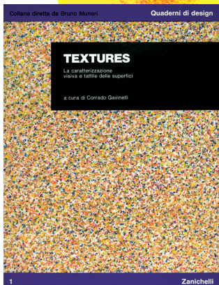
Corrado Gavinelli Textures La caratterizzazione visiva e tattile delle superfici Quaderni di design, 1 1976

«D'inverno la natura dorme e quando sogna appare la nebbia. Camminare dentro la nebbia è come curiosare nel sogno della natura: gli uccelli fanno voli corti per non perdere l'orientamento, scompaiono i segnali e i divieti nelle strade, i veicoli vanno piano e si fa appena in tempo a riconoscerli che spariscono. Le luci rosse, verdi, gialle colorano nella notte vaste masse di nebbia, tutto diventa irreali. Solo all' interno delle case gli uomini e gli animali continuano la loro attività.»