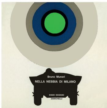
Bruno Munari Nella nebbia di Milano Edizioni Emme-Zanichelli 1968

«D'inverno la natura dorme e quando sogna appare la nebbia. Camminare dentro la nebbia è come curiosare nel sogno della natura: gli uccelli fanno voli corti per non perdere l'orientamento, scompaiono i segnali e i divieti nelle strade, i veicoli vanno piano e si fa appena in tempo a riconoscerli che spariscono. Le luci rosse, verdi, gialle colorano nella notte vaste masse di nebbia, tutto diventa irreali. Solo all' interno delle case gli uomini e gli animali continuano la loro attività.»