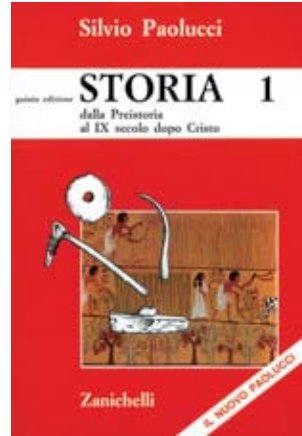
Silvio Paolucci Storia Quinta edizione 3 volumi 1987

Silvio Paolucci Giuseppina Signorini Il corso della storia 3 volumi 1995-96