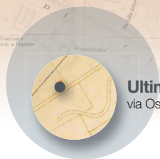
Ultima casa di Carducci via Osservanza

(Cartina di Bologna dalla guida di Corrado Ricci, Zanichelli 1906)