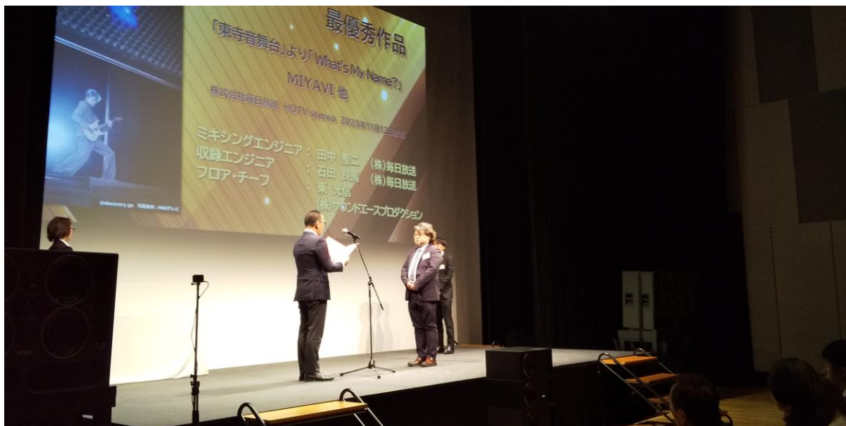
写真:授賞式の様子

日本プロ音楽録音賞の受賞は、今年の「サントリー1万人の第九 2022 / LIFE is Symphony 歌って、世界中を幸せにしよう。」に続いての受賞で、MBSとしては5度目の受賞となります。