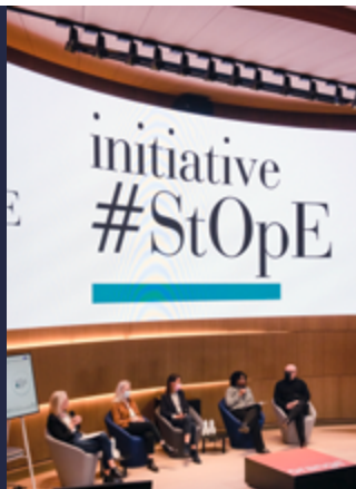
Table ronde Sexisme et génération , cérémonie annuelle 2022