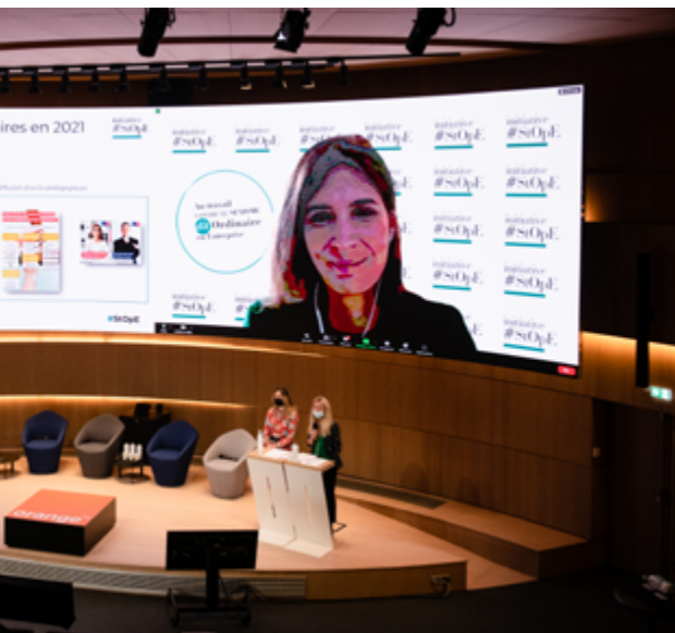
Cérémonie annuelle, 2022

Padlet , application en ligne de contenus collaboratifs