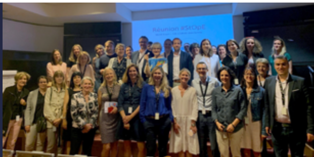
Réunion trimestrielle, juin 2019