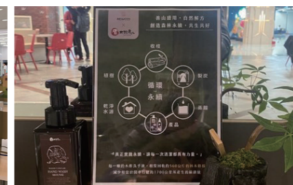
商場使用木酢洗手慕斯宣揚循環利用理念