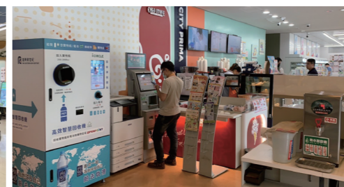
商場引進 Icircle 智能回收機