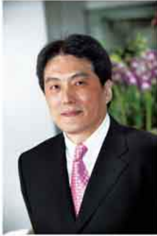
統一超商董事長 羅智先