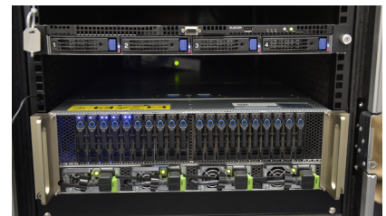
Tesla P100を8基搭載したNVIDIA DGX-1

の、動画解析はまだまだ難しい状況だといふ。なぜなら、例えば映像が動いている場合、その動きが撮影者によるものなのか、それとも撮影対象によるものなのかを認識する必要が出てくるなど、これまで以上にチェックすべきポイントが増えてくるからだ。これは当然、これまで以上に計算量が増えることを意味し、動画解析ではさらなるマシン性能の向上が求められることとなる。