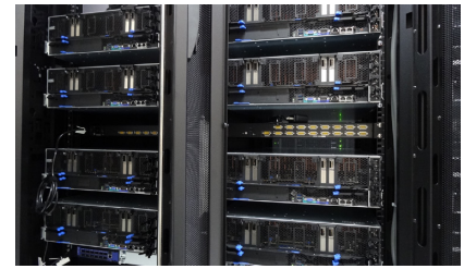
NVIDIA® Tesla® V100を8基搭載するNVIDIA DGX-1™は、データセンターに設置されている