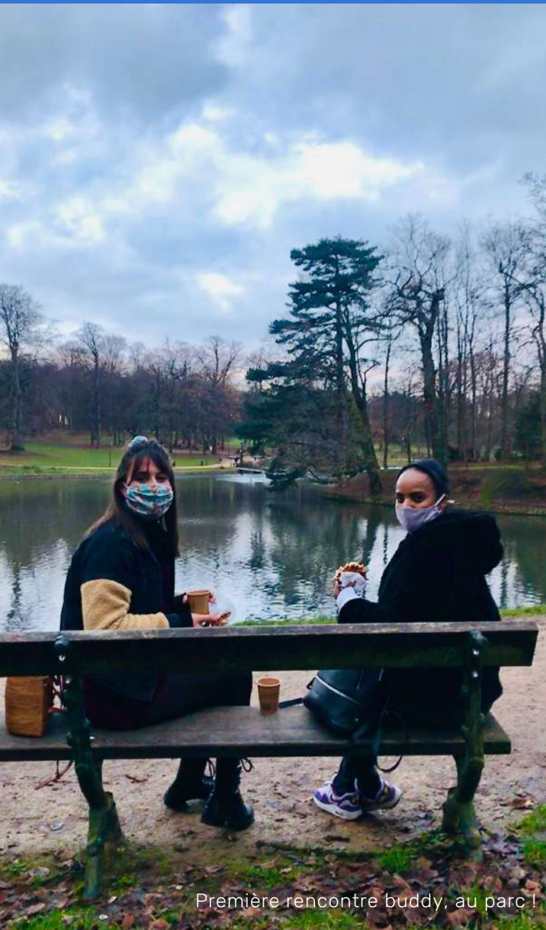
Première rencontre buddy, au parc !

Le rôle de l'adminbuddy est d'accompagner le nouveau colocataire dans ses démarches administratives à Bruxelles (ouverture d'un compte en banque, mutuelle, etc.)