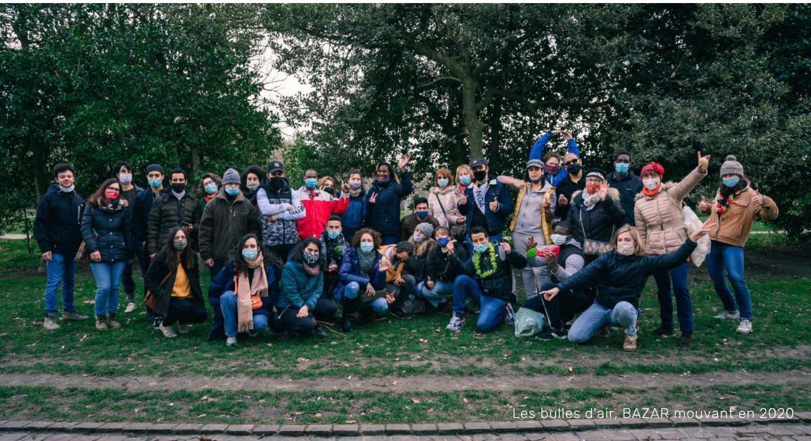
Les bulles d'air, BAZAR mouvant en 2020